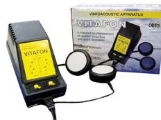
VITAFON Urządzenie wibroakustyczne