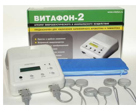
VITAFON-2 Wibroakustyczne urządzenie z promieniowaniem podczerwonym

Dystrybutor w Polsce: VITAFON PL, ul. Warecka 5/7, 00-034 Warszawa tel.(022) 8280530 e-mail biuro@vitafon.pl