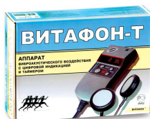
VITAFON-T Urządzenie wibroakustyczne z odczytem cyfrowym i wyłącznikiem czasowym